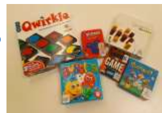
Jeux Cycles 2 ou 3

Plus d'information sur la fiche ci-jointe