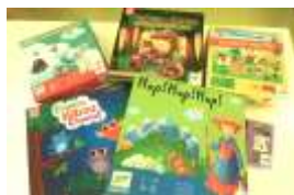
Jeux Cycle 1

Inscriptions en contactant M. Belhoul à m.belhoul@occe.coop